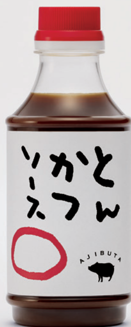
あじ豚とんかつソース | 株式会社ゲシュマック | 2015年 -